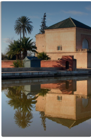
MARRAKECH Ville de départ